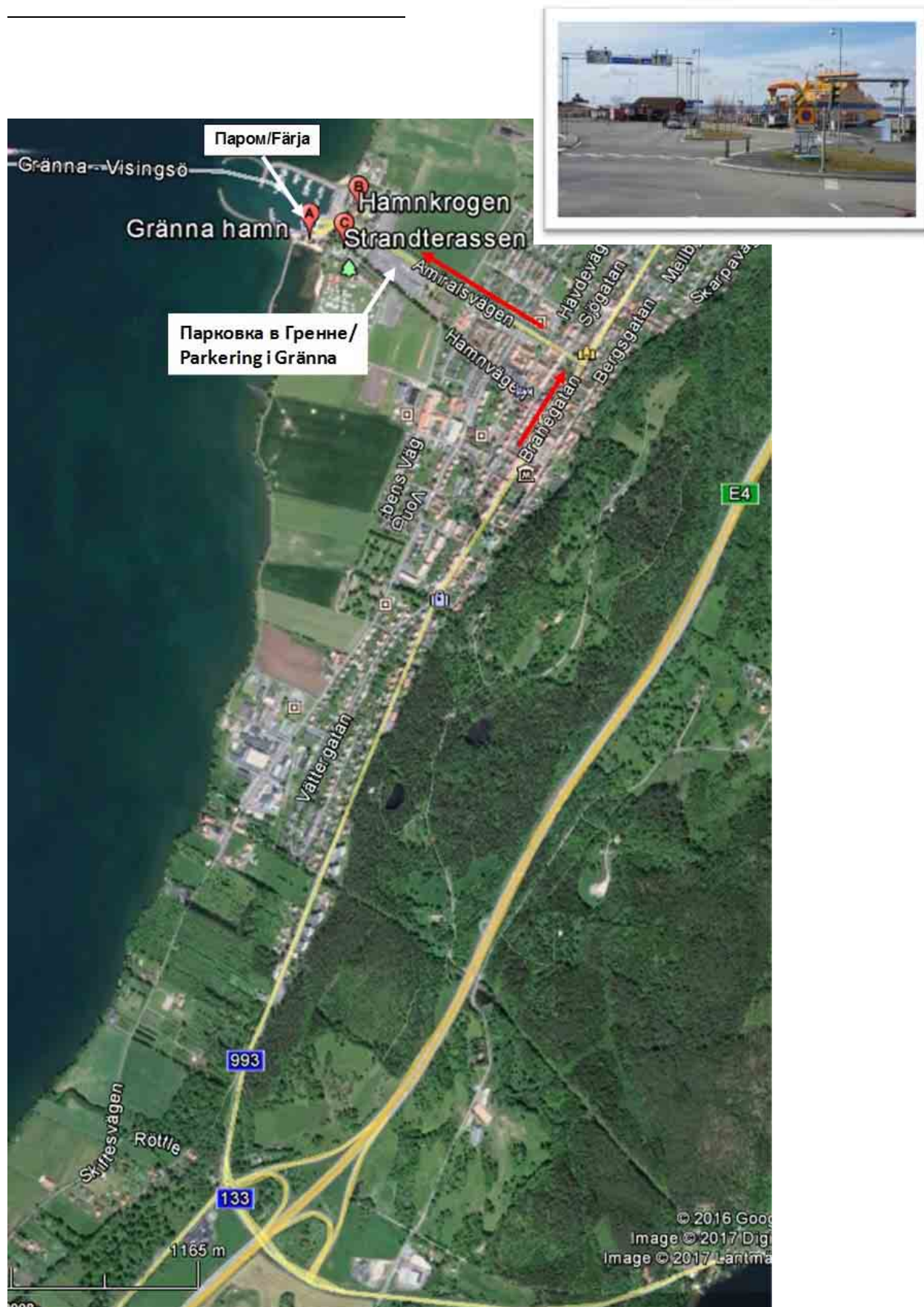
Съезд в Гренну с E4, парковка и паромный причал в Гренне / E4 Avfarten till Gränna, parkering och hamnen i Gränna