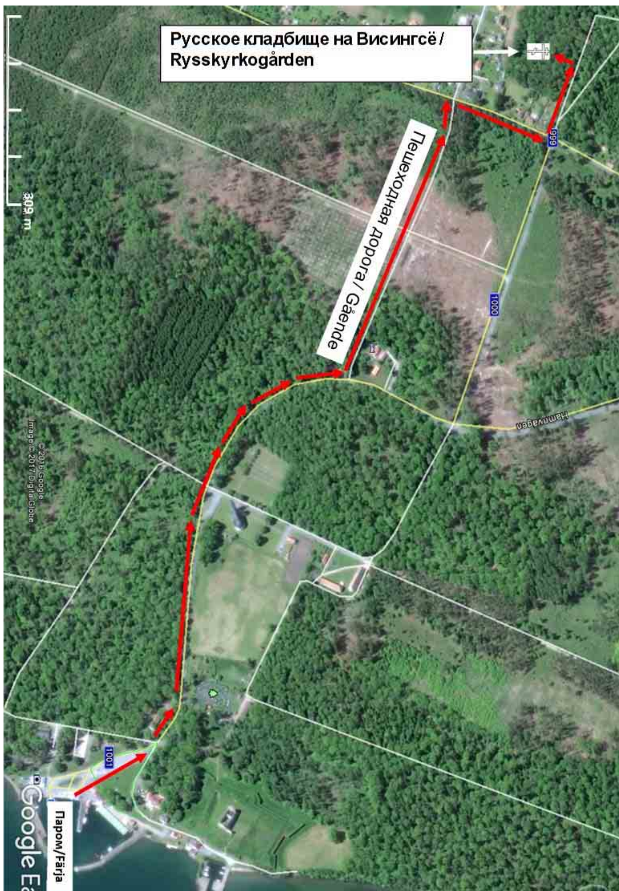
Описание (пешеходной) дороги от причала Висингсё до Русского кладбища / Vägbeskrivning från Visingsö hamn till Rysskyrkogården