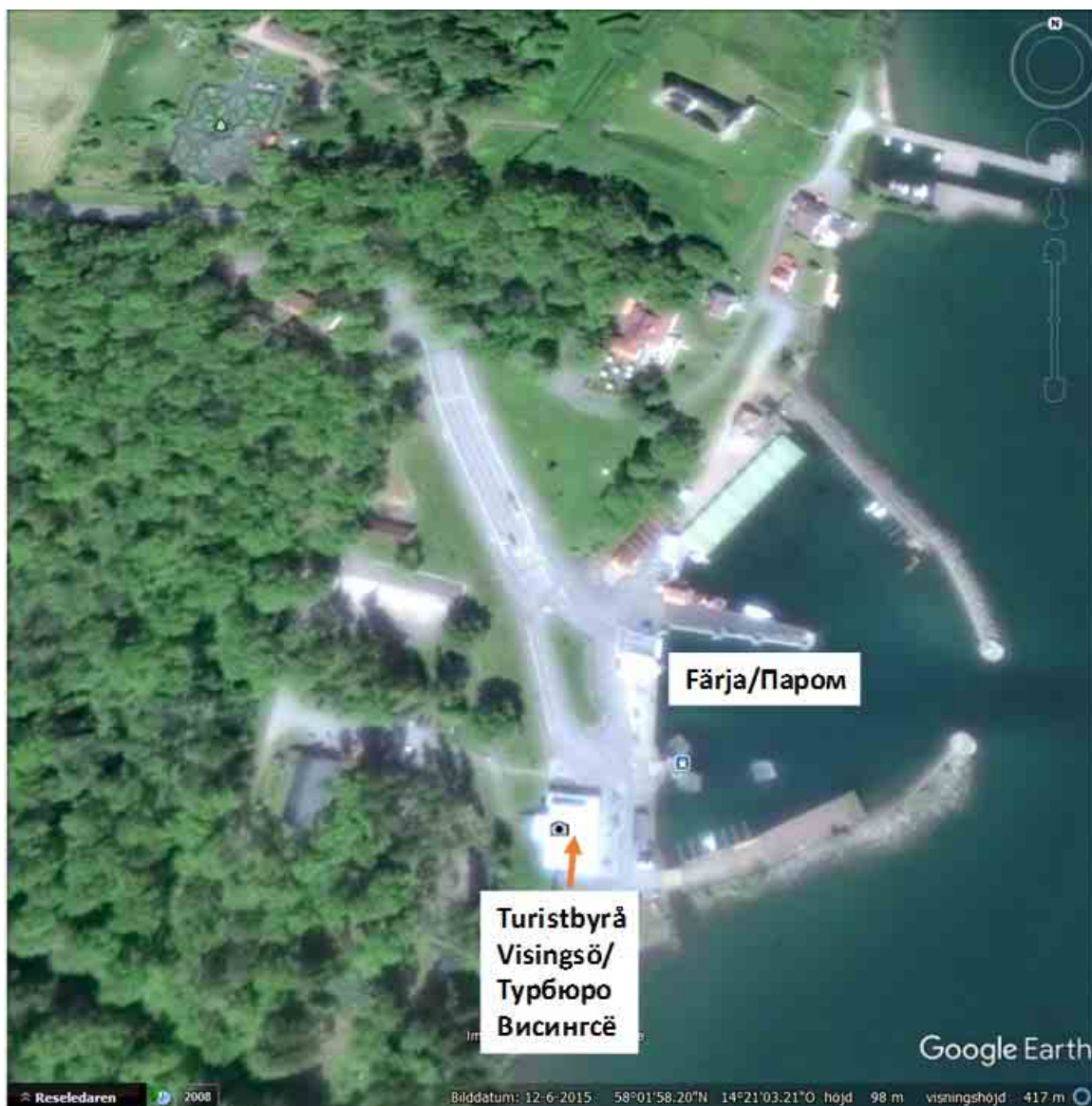
Причал о. Висингсё / Visingsö hamn